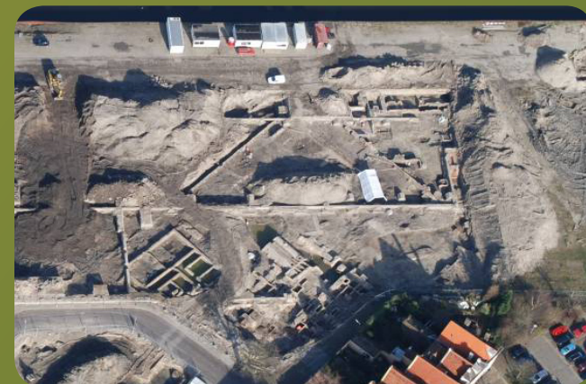
Luchtfoto van opgravingen.