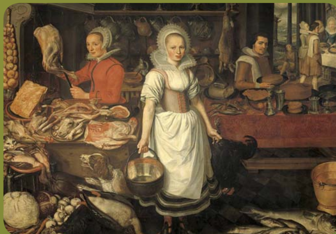
Keukeninterieurs begin 17e eeuw, P.C. van Rijck, collectie Rijksmuseum Amsterdam

Uit de archieven doken ook lijsten en documenten op met de verschillende eigenaars en bewoners van de meeste opgegraven panden. Zo leefden ambachtslieden en arbeiders broederlijk naast kapiteins, handelslieden en bewindhebbers. Eén van de meest in het oog springende figuren bleek de bekende reder Cornelis Lampsins te zijn, baron van Tobago en oud-burgemeester van Vlissingen. In de rijke beerput van Lampsins werd ondermeer een 17e-eeuws Japans bord in Kutani porselein gevonden, voor zover bekend het oudste voorbeeld in Nederland van geïmporteed Japans porselein!