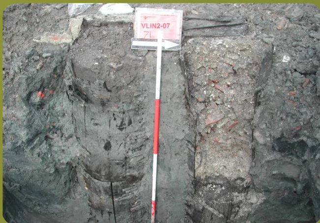
Waterputten van tonnen opgevuld met afval.

De gemeente Vlissingen is opdrachtgever van het onderzoek; onderzoeksbureau ADC-ArcheoProjecten heeft het onderzoek uitgevoerd volgens de strategie en vraagstelling zoals deze door de Walcherse Archeologische Dienst (WAD) zijn opgesteld. De resultaten van het onderzoek zullen ook in de vorm van een publieksboek worden gepresenteerd. Voor meer informatie: bm@vlissingen.nl of bss@vlissingen.nl