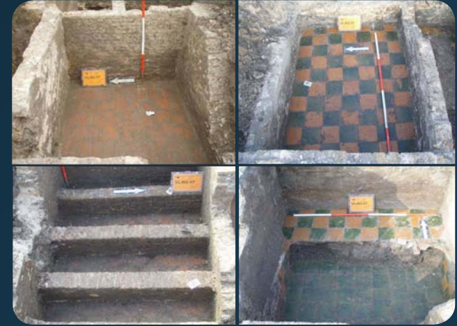
Engelse Kerk, grafkeldertjes.

Om een beeld te krijgen van de Vlissinger uit de 17e en 18e eeuw, zijn tijdens het archeologisch onderzoek 100 skeletten voor verdere studie geselecteerd. Deze zijn aangevuld met nog eens 100 skeletten van het voormalige kerkhof rond de Sint Jacobskerk op de Oude Markt. Deze zijn van Vlissingers uit de 14e tot en met de 16e eeuw. Onderzoek naar skeletten richt zich op de fysieke gesteldheid van de individuen: grootte, kracht, ziektebeelden, enz. Op deze manier was het mogelijk een beeld te schetsen van ruim zes eeuwen Vlissingers.