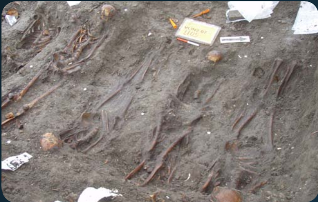
Engelse Kerk, graven op het kerkhof.