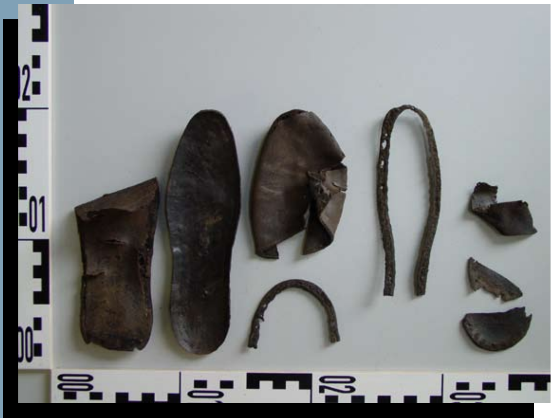
Leren sandaal, gevonden in de gracht langs de brug.

Tijdens het onderzoek werden geen sporen van een woonhuis gevonden. Mogelijk viel de bebouwing, weergegeven op de kaart van Hattinga, net buiten het bereik van de proefsleuf. Het voorterrein staat op alle historische kaarten leeg weergegeven en zal waarschijnlijk dienst gedaan hebben als tuin.