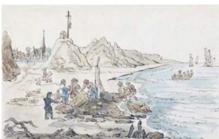
Vondst Nehalennia altaren bij Domburg

Deze Nehalennia-cultus, de verspreiding, leefomstandigheden en activiteiten van de bewoners, de strijd tegen het water met bijhorende infrastructuurwerken en de ontwikkeling van het landschap vormen de belangrijkste aandachtspunten binnen dit thema.