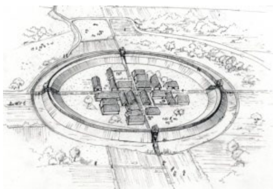
Impressie burg Oost-Souburg in de 10e eeuw (© Polderman, 2003)

Naast de reconstructie van de leefwijzen en leefomstandigheden vormen natuurlijk de inrichting van de ringwalburgen en de invallen van de Vikingen in de 9e eeuw een interessant subthema. Waren zij enkel uit op het plunderen van de Walcherse kusten of reikte hun invloed verder en moeten we ook denken aan daadwerkelijke vestigingen en handelscontacten?