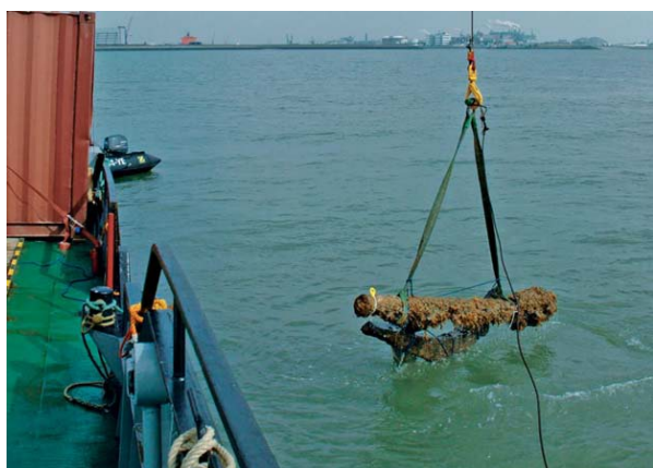
onderzoek scheepswrak de Ritthem

Op een geringere diepte onder de zeebodem, soms ook gewoon nog op de zeebodem liggen scheepswrakken of losse scheepsonderdelen uit de verschillende voorbije eeuwen. In de landelijke archeologische database (Archis 3) zijn enkele bekende wraklocaties opgenomen. Van Rijkswaterstaat (RWS) en van sportduikers weten we dat er op en net onder de bodem een veelvoud van deze wraklocaties voor de kust van Walcheren ligt.