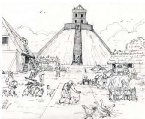
leven rond een mottekasteel

Als aanvulling op de archivale bronnen blijft de ontwikkelingsgeschiedenis van de Walcherse steden, de stadsopbouw en -uitbreiding en de leefomstandigheden van de inwoners een belangrijk aandachtspunt. Zo kan er gewerkt worden aan een overzicht van de leefwijzen van de Zeeuwen door de geschiedenis heen. Ook over de specifieke ontstaans- en ontwikkelingsgeschiedenis van de dorpen is tot op heden nog weinig bekend. De vliedbergen zelf met daarbij speciale aandacht voor de neerhoven bij de bergen vormen eveneens een onderzoeksluik, vooral daar waar ze aan de basis stonden van de stichting van de dorpen.