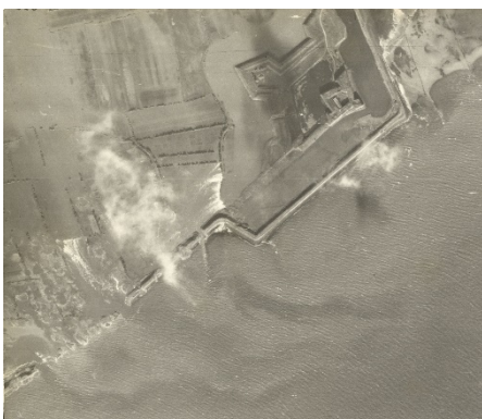
inundatie bij Rammekens 1944

Voor de Tweede Wereldoorlog is één van de best gedocumenteerde periode van onze geschiedenis. Desondanks wijzen verschillende archeologische onderzoeken in de afgelopen jaren uit dat toch veel nieuws is te vinden en dat deze vorm van archeologie bij velen grote interesse wekt. Het is ook een onderwerp dat nog veel emoties kent.